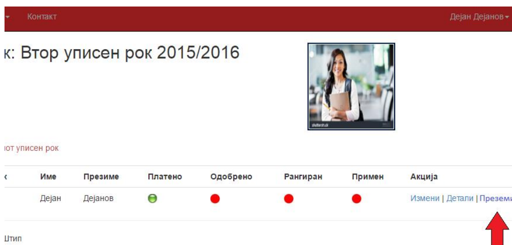
Слика 5.12. Преземање на апликација заради печатење

кандидатот е потребно да ја преземе (слика 5.12) и испечати апликацијата (печатена верзија од истата, слика 5.13.) и заедно со другите потребни документи наведени во конкурсот за пријавување и упис на нови студенти (свидетелства, диплома од средно, извод, државјанство, други документи по потреба), во наменските термини за секој уписен рок (прв, втор или трет, зависно за кој се однесува електронската апликација) ги приложува физички , соодветно во градот / местото / конкурсната комисија на факултетот / студиската програма на која се пријавува со највисок приоритет (Избор 1 во апликацијата).