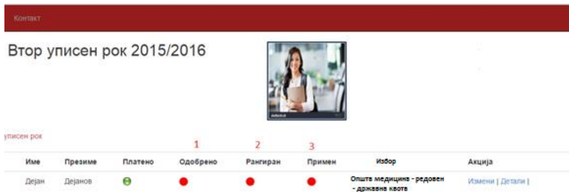
Слика 5.14. Семафори за следење на статусот на апликацијата

Доколку апликацијата била рангирана во моментот на преглед, во тој случај семафорот (2) станува зелен (апликацијата била рангирана со сите до тој момент внесени апликации во системот за пријавување и рангирање).